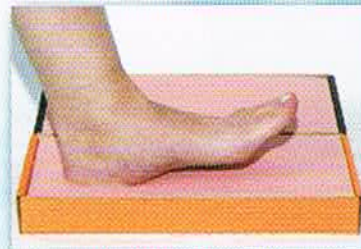
●踵から自然に体重をかけます。