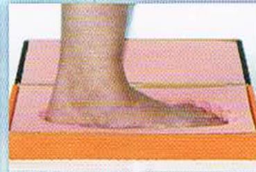
●前足部にも体重をかけます。